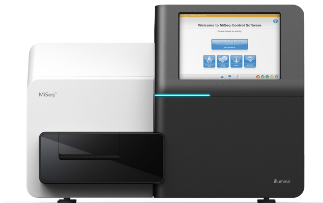
图 1: MiSeq 系统 — 外形小巧的 MiSeq 系统非常适合用于进行快速、具成本效益的新一代测序。

MiSeq 系统提供了首个 DNA 到数据测序平台，将簇生成、扩增、测序和数据分析功能整合到一台仪器中。该系统占地面积小，只需约两平方英尺，很容易安置于几乎任何实验室环境中 (图 1)。MiSeq 系统利用 Illumina 的边合成边测序 (SBS) 化学技术，这是一项成熟的新一代测序 (NGS) 技术，全球超过 90% 的测序数据都是基于此技术生成的。 1 MiSeq 系统外形小巧却具有强大的 NGS 功能，是以经济实惠的方式快速进行基因分析的理想平台。