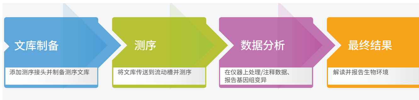
图 2: MiSeq 系统工作流程 — MiSeq 系统工作流程经过了简化，可为新一代桌上测序实现快速处理。可以使用任何兼容的文库制备试剂盒来制备文库。测序时间共五个半小时，包括在使用 MiSeq Control Software 的 MiSeq 系统上运行簇生成、测序、启用了双面扫描 (2 × 25 碱基对) 的评定质量分值碱基检出所花费的时间。

快速的文库制备过程和 MiSeq 系统的强大功能可以简化工作流程，加快处理速度 (图 2)，只需数小时而非几天即可获得结果。使用 Illumina DNA Prep 文库制备试剂只需三个小时即可制备测序文库，然后在 MiSeq 系统上只需 5.5 个小时即可完成自动化克隆扩增、测序和评定质量分值的碱基检出 (表 1)。序列比对可直接在机载仪器计算机上使用 MiSeq Local Run Manager 软件完成，或通过 BaseSpace Sequence Hub 完成，所需时间不到三个小时。