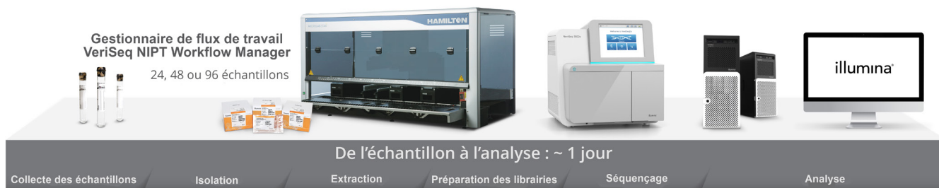
Figure 1 : Flux de travail de DIV exhaustif pour le DPNI – la solution VeriSeq NIPT Solution v2 fournit tout ce dont vous avez besoin pour le DPNI par SNG, notamment les réactifs pour l'extraction de l'ADN, la préparation de bibliothèques et le séquençage; les instruments pour la préparation automatisée des bibliothèques et le séquençage à l'aide d'un gestionnaire de flux de travail; un serveur sur site pour analyser et stocker les données en toute sécurité; un logiciel d'analyse de données capable de produire un rapport qui fournit des résultats qualitatifs.

La solution VeriSeq NIPT Solution v2 est validée pour déterminer la fiabilité et la précision clinique. Une étude de validation clinique a été menée à partir des échantillons de femmes enceintes ciblées qui étaient admissibles au test si les résultats cliniques étaient accessibles et répondaient aux critères d'inclusion. La cohorte comprenait des sujets dont l'âge gestationnel était d'au moins 10 semaines, des échantillons à faible fraction fœtale et des grossesses gémellaires. L'étude a été réalisée en analysant, à l'aide de VeriSeq NIPT Solution v2, plus de 2 300 échantillons de sang maternel, pour lesquels les résultats de trisomie 21, de trisomie 18, de trisomie 13, de RAA, de délétions et de duplications partielles \geq 7 Mb pour l'ensemble des autosomes et de SCA étaient connus. Les résultats ont été comparés aux données de référence clinique.